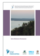
Selva Misionera Paranaense