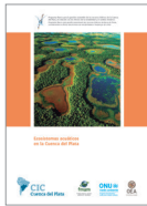
Ecosistemas acuáticos en la Cuenca del Plata