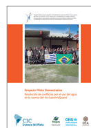
Proyecto Piloto Demostrativo Resolución de conflictos por el uso del agua en la cuenca del río Cuareim/Quaraí