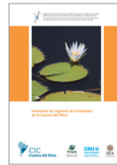
Inventario de Regiones de Humedales de la Cuenca del Plata