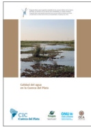
Calidad del agua en la Cuenca del Plata