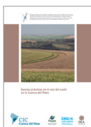
Buenas prácticas en el uso del suelo en la Cuenca del Plata