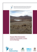
Proyecto Piloto Demostrativo Control de contaminación y erosión en el río Pilcomayo