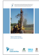
Aguas subterráneas en la Cuenca del Plata