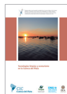
Tecnologías limpias y ecoturismo en la Cuenca del Plata