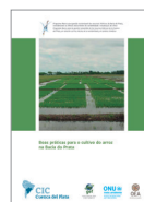
Boas práticas para o cultivo do arroz na Bacia do Prata