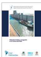
Hidroelectricidad y navegación en la Cuenca del Plata