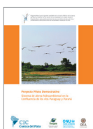
Proyecto Piloto Demostrativo Sistema de alerta hidroambiental en la confluencia de los ríos Paraguay y Paraná