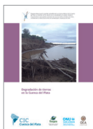
Degradación de tierras en la Cuenca del Plata