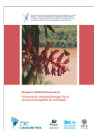
Proyecto Piloto Demostrativo Conservación de la biodiversidad íctica en una zona regulada del río Paraná